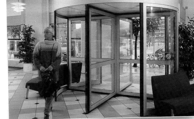
Presidi per la sicurezza degli ingressi di un edificio. Articolo di Gianni Andrei a pag. 670

Le nostre testate e l'attività editoriale: